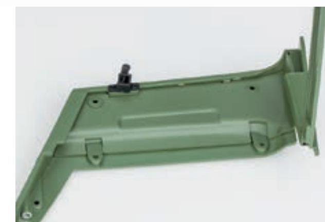
Шаг 3. С внутренней стороны каркаса кузова, в задней правой части, установите вставку панели багажника. Деталь должна плотно прилегать к поверхности каркаса.