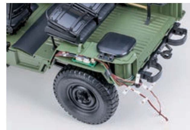
Шаг 1. Отсоедините провода с маркировкой E и G от шасси модели (провода со светодиодами заднего правого фонаря).

Для улучшения внешнего вида модели рекомендуется зеркально переставить правый упор рамки ветрового окна, расположенный в ее верхней части. Для этого снимите правый упор и закрепите его снова таким образом, чтобы площадка на кронштейне была расположена ближе к центру окна.