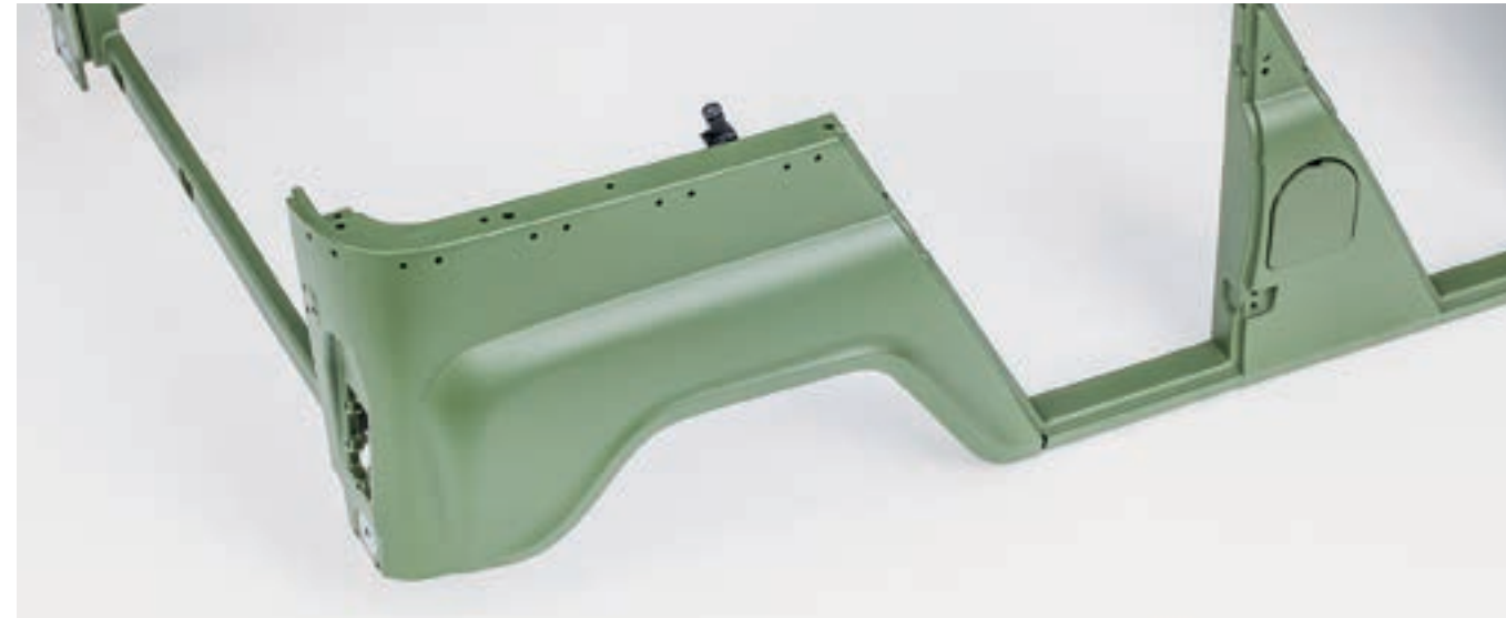
Кузов с установленными передними и задними крыльями

Шаг 4. С наружной стороны каркаса разместите заднее правое крыло. Совместите крепежные отверстия крыла, каркаса кузова и внутренней вставки панели багажника. Закрепите детали с внутренней стороны каркаса при помощи пяти винтов 2,3×5 (IM).