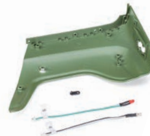
Шаг 2. Закрепите провода E и G фиксатором на внутренней поверхности заднего правого крыла. Для крепления проводов используйте винт 1,7×3 (LM).